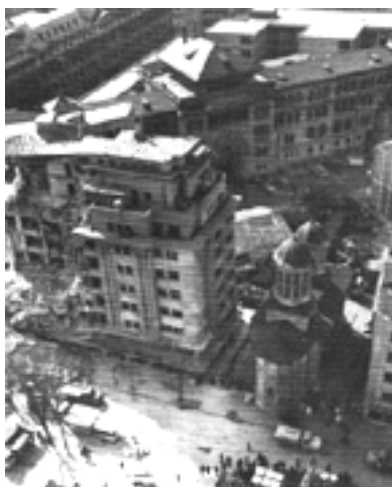
Biserica Enei demolată de Ceaușescu pentru că "era avariată după cutremurul din 1977" (fotografie din 10 martie 1977 din care se vede că biserica este întreagă doar cladirea de alături este avariată)

Te-am văzut, tânărul meu prieten, brutalizat de cei mai în vârstă, jignit și insultat, numai din vina de a fi tânăr. Ți-am vorbit atunci ca unui om cu slăbiciuni și dureri, ca unei ființe sensibile și fără apărare.