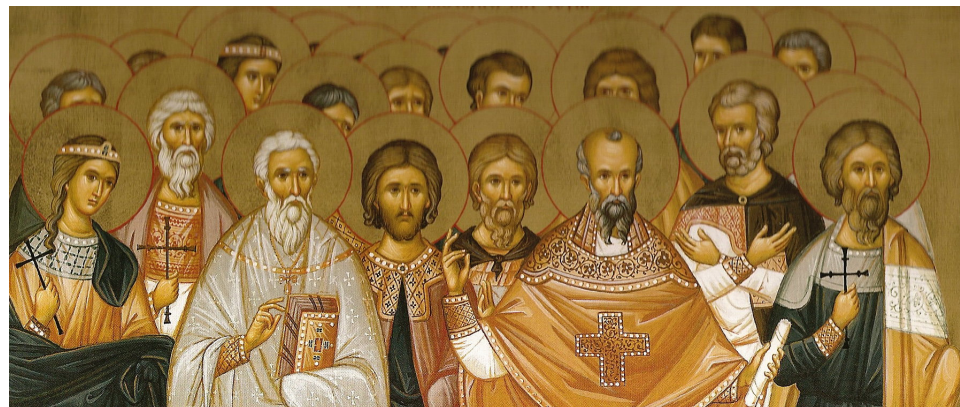
Cei 26 de mucenici din Goția (pictură de Sf. Mănăstire Diaconesti)

Sinaxar 26 martie: pomenirea sfinților 26 de mucenici, care au pătimit în Goția, din care doi au fost preoți: Vatus și Virca; cu acesta din urmă au pătimit și doi fii și trei fiice ale lui; apoi unul, Aprilla, a fost monah; unsprezece au fost mireni: Avip, Agna, Riax, Igratrax, Iscoos, Sila, Sighita, Suiril, Seimvla, Terma, Filga; și șapte femei: Ana, Alla, Varis, Moico, Mamica, Birgo și Animais. Tot în această zi: prăznuirea Soborului arhanghelului Gavriil, ca unul care a slujit tainei dumnezeiești celei negrăite și mai presus de fire a Întropării Domnului.